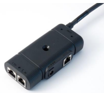
Anschlussbox (ab Werk vormontiert)