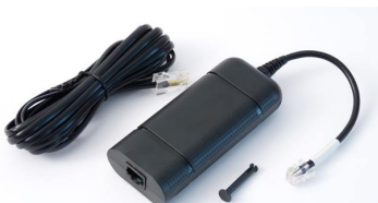
ISDN-KIT bestehend aus ISDN Modem, ISDN-Kabel und Verbindungsclip (optional erhältlich)